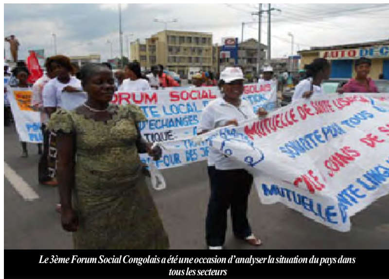
Le 3ème Forum Social Congolais a été une occasion d'analyser la situation du pays dans tous les secteurs

Nous appelons les candidats aux élections présidentielles et législatives à présenter et à défendre leurs programmes sociaux. Et nous