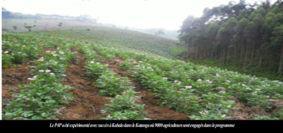
Le P4P a été expérimenté avec succès à Kabalo dans le Katanga où 9000 agriculteurs sont engagés dans le programme

Le Programme alimentaire mondial des Nations Unies (PAM) a été célébré le 28 octobre 2011, la Journée de la sécurité alimentaire et nutritionnelle en Afrique, en mettant l'accent sur l'importance des marchés régionaux et des denrées produites localement dans l'amélioration de l'accès à l'alimentation aussi bien au niveau national qu'au niveau des ménages. «Le PAM travaille avec les gouvernements et les communautés dans toute l'Afrique afin de briser le cercle omniprésent de la faim», explique Sheila Sisulu, Directrice Exécutive Adjointe du PAM. «Nous aidons à mettre en place des solutions contre la faim menées pour les pays tout promouvant la croissance et le développement. En même temps, nous fournissons une assistance vitale aux victimes de crises, comme dans les cas de la sécheresse dans la Corne de l'Afrique et des mouvements de populations liés aux violences postélectorales en Côte d'Ivoire.» En 2010, en Afrique, le PAM a atteint près de 46 millions de personnes dans 40 pays. L'assistance du PAM sur le continent se concentre sur les opérations d'urgence, la réhabilitation après-crise et les programmes à long-terme afin de réduire la faim chronique et la malnutrition. « Ici, en République Démocratique du Congo, le PAM apporte une assistance à plus de 3 millions de personnes, dont un million d'enfants à travers son programme de cantines scolaires, a indiqué Kojo Anyanful, directeur adjoint du PAM en RDC.