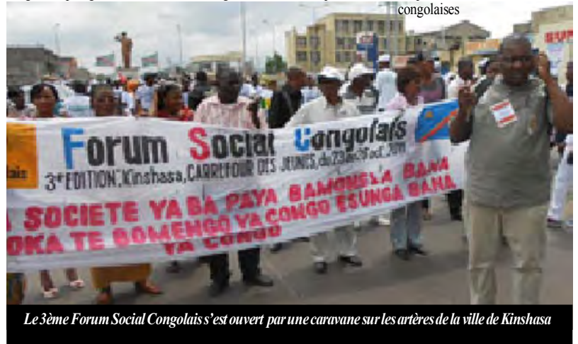
Le 3ème Forum Social Congolais s'est ouvert par une caravane sur les artères de la ville de Kinshasa

tous les aliments importés qui arrivent en RDC est souvent sujet à caution à tel point que certaines personnes les accusent d'être à la base de certaines maladies comme les myomes, les fibromes... devenues très fréquentes chez les femmes congolaises