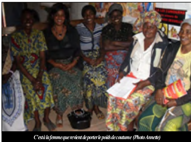
C'est à la femme que revient de porter le poids de coutume