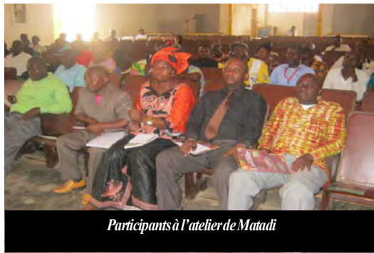
Participants à l'atelier de Matadi

Du 28 au 29 juin 2011 un atelier, organisé à Kinshasa placé sous le thème « SECURITE ALIMENTAIRE NECESSAIRE ? POSSIBLE ? POUR UN CONGO PROSPERE » OU DES DISCUSSIONS ONT FORTE sur oui, l'aide d'urgence doit éviter des distributions gratuites, doit être faite d'une telle façon que le développement ne sera pas heurté mais sera plutôt favorisé. Le débat se concentrait sur l'approche pour faire développer l'agriculture congolaise, dans l'Est et ailleurs. Une opinion commune s'est développée au cours de l'atelier : l'intensification agricole sur la base des intrants externes en cherchant une production compétitive est la voie à suivre. La bonne présence de la presse a fait un écho fort dans le pays. Les appels dans tous les coins du pays ont été enregistrés. C'est ainsi que Catalyst a décidé d'organiser des ateliers provinciaux dans les provinces du Bas Congo, Katanga, Kasai oriental, Nord Kivu et Sud Kivu. Toutes les provinces manifestent l'intérêt aux approches promues par CATALIST et ces manifestations rencontrent le souci de CATALIST de faire bouger toute la RDC en matière d'intensification agricole. Lors de l'atelier de Matadi organisé du 17 au 18 novembre 2011, Samson Chirhuza, coordonnateur de l'IFDC/RDC a affirmé que « sans sécurité alimentaire, il n'y a pas de paix ».