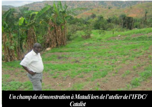
Un champ de démonstration à Matadi lors de l'atelier de l'IFDC/Catalist

-Vulgariser le code agricole (bannir les phénomènes DIA NKALA, LUTA