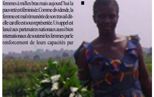
La femme doit être renforcée en techniques nouvelles pour cultiver.

l'implantation des institutions des crédits agricoles, en subventionnant l'agriculture et en construisant les infrastructures de bases.