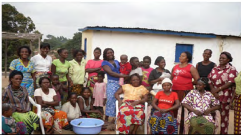
Les femmes du Mayombe après l'atelier

19. Kangila mwana khombo mosi ngudi khombo kabika kuenda. - Attachez le cheveau pour que sa mère ne s'éloigne - Dans les conflits conjugaux les enfants sont les unificateurs.