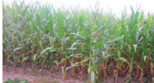
Le maïs est un produit de base dans l'alimentation au Kasaï Oriental

marchés du Kasaï-Oriental. Un bol de 3 kg et demi qui se vendait, il y a une semaine, à 1800 francs congolais, est passé à 2 500 francs (2.7 USD) à Mbuji-Mayi. Pour baisser le prix de maïs-produit de base de l'alimentation au Kasaï-Oriental, Alphonse Ngoyi Kasanji, qui s'est rendu à Mwene-Ditu, a décidé d'exempter les opérateurs économiques de certaines taxes provinciales, évaluées à plus de 50$ US par camion. Il s'agit notamment de celles payées lors du déchargement de la marchandise à la gare et celles de péage, à la sortie de Mwene-Ditu et à l'entrée de Mbuji-Mayi. Le directeur de la SNCC/Mwene-Ditu a indiqué qu'il devrait réceptionner, à partir de la semaine prochaine, une trentaine de wagons de maïs, dont vingt-neuf se trouveraient déjà à Kamina. OKAPI