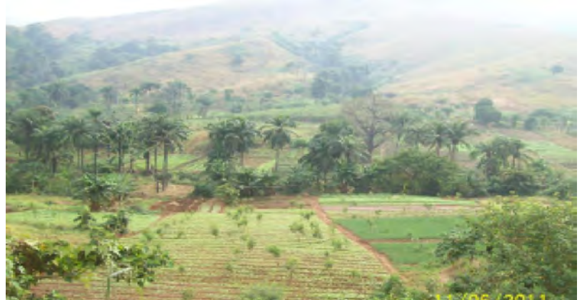
La RDC n'est autosuffisante pas pour quelques rares produits alimentaires : le manioc, les légumes, la banane de table, la banane plantain.