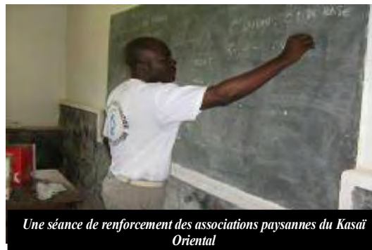
Une séance de renforcement des associations paysannes du Kasaï Oriental

associations paysannes existantes tout en les comparant aux normes prévues en matière d'organisation des associations. Dans cet ordre d'idées, des notions sur la procédure à suivre pour parvenir à la création des organisations paysannes crédibles ont été exposées par les facilitateurs de la session de renforcement