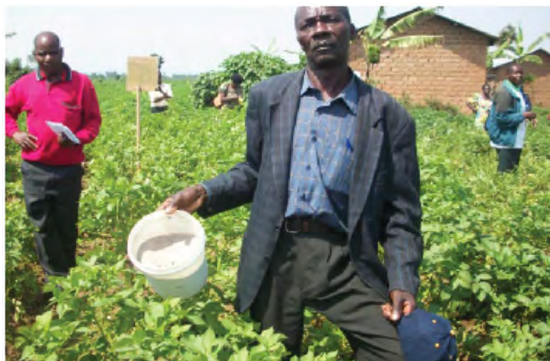
La culture de pomme de terre est de grande importance dans tous les pays de Grands Lacs

demande est toujours croissante de la pomme de terre de la part des consommateurs. Depuis plusieurs années, dans chacun de ces pays, les producteurs entreprennent des initiatives intéressantes pour améliorer la production de pommes de terre, pour mieux servir les marchés, et pour mieux gagner leur vie dans ce secteur. Or, à plusieurs niveaux de la chaîne, les différents acteurs de la filière dans chaque pays rencontrent encore des contraintes dans leurs efforts d'augmenter la production de la pomme de terre aussi bien en quantité qu'en qualité et même dans la conservation, la transformation et l'écoulement de la production.