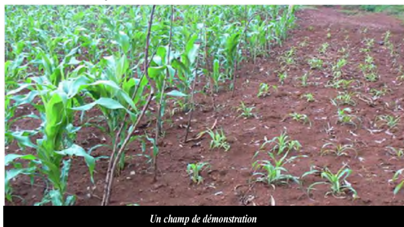
Un champ de démonstration

d'azote, l'élément nutritif le plus limitatif. En plus il faut en général ajouter du phosphore, et souvent de la potasse. Supposons que l'azote et les autres éléments sont apportés sous forme de fumier. Compte tenu de la concentration d'azote du fumier, de l'ordre de 0,5%, il faut appliquer saisonnièrement 32 t/ha de fumier ! Hélas, le bétail trouve peu à brouter et peu de fumier est produit. Une vache nourrit sur des parcours pauvres à cause des sols pauvres, produit annuellement à peine 1 tonne de bouses, dont seulement une fraction peut être