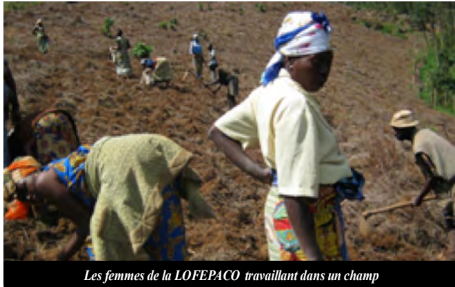
Les femmes de la LOFEPACO travaillant dans un champ