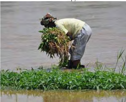
Une femme maraîchère à la périphérie de la ville de Kinshasa

tonnes de riz. Selon la même source, s'ils sont mis en valeur, ces sites produiraient au moins 30000 tonnes par an et couvriraient plus de 50% de besoins de la capitale qui consommerait 40% des importations de riz dupays.