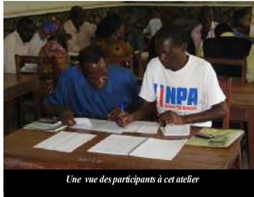
Une vue des participants à cet atelier