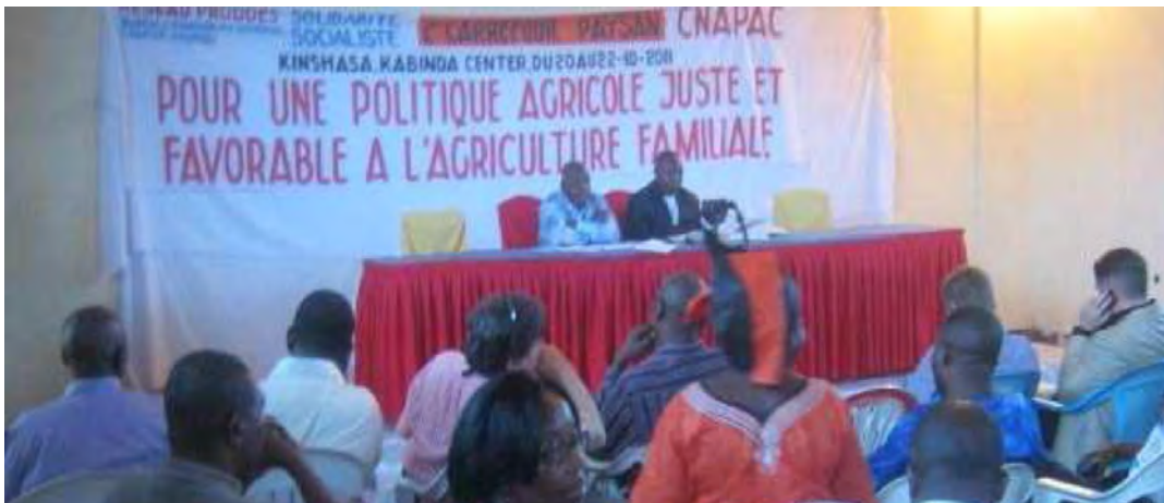
Une vue des participants aux travaux du Deuxième Carrefour Paysan à Kinshasa

sommes-nous ? ». Des représentants des organisations paysannes venues de tous les coins de la RD Congo ont eu à partager au cours de ces assises, des informations diverses sur l'état actuel de l'agriculture congolaise dans leurs environnements divers. Ils y ont également contribué aux analyses participatives de la situation du monde paysan congolais en général et de l'agriculture congolaise en particulier. Ainsi, avons-nous profité de cette occasion pour recueillir quelques réactions auprès certains représentants des provinces.